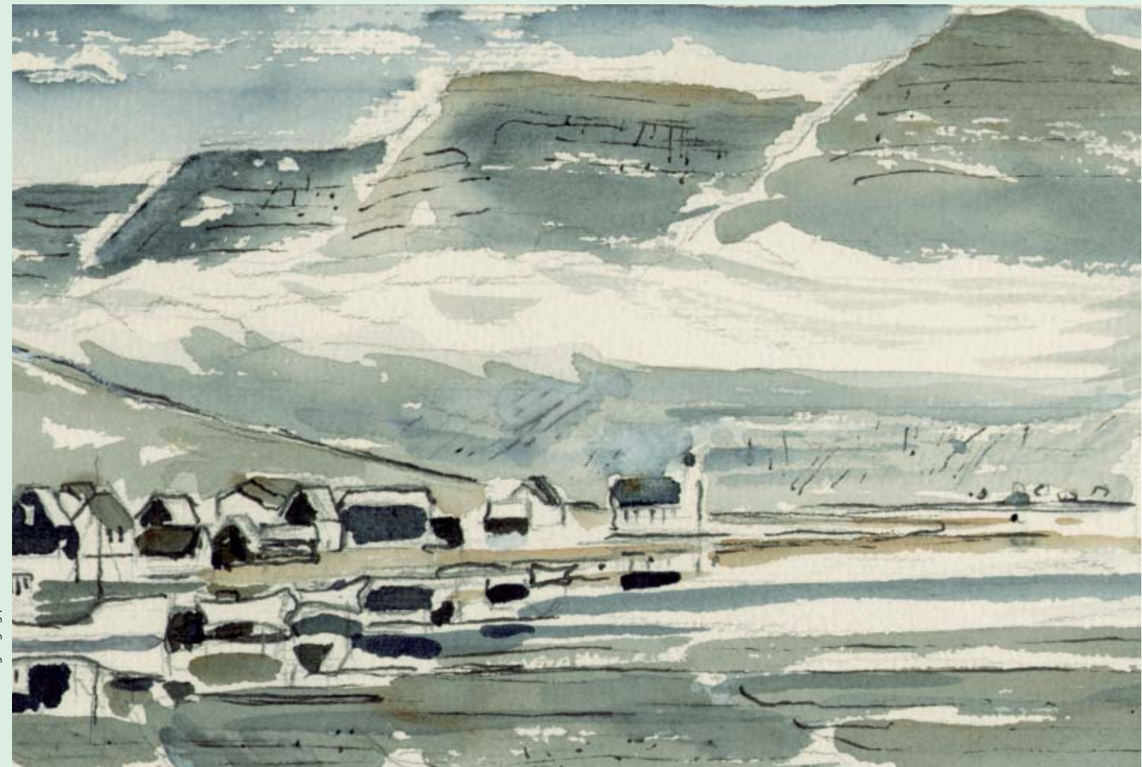
Grafisk tilrettelægning og print: Danmarks Nationalbank

Danmarks Nationalbank Havnegade 5 DK-1093 Copenhagen K