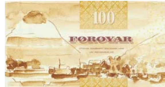
Støddir: 135x72 mm. Komin 16. januar í 2003.