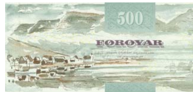
Støddir: 155x72 mm. Komin 30. november í 2004.