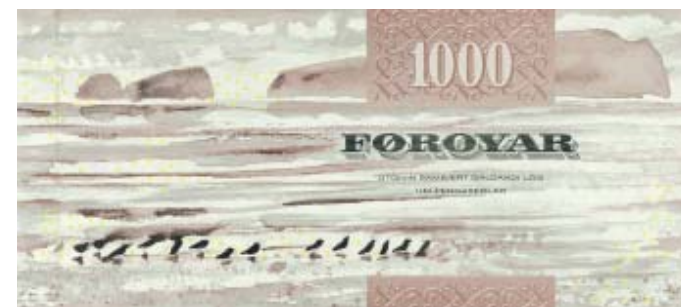
Støddir: 165x72 mm. Komin 15. september í 2005.