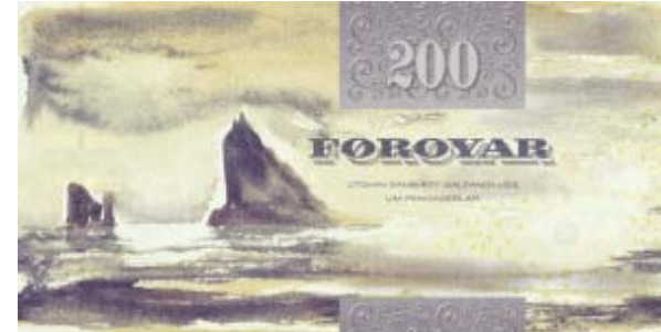
Støddir: 145x72 mm. Komin 19. januar í 2004