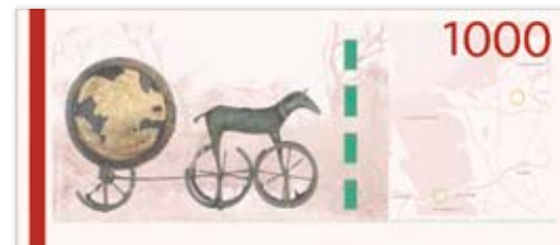
Maj 2011 – Storebæltsbroen og Solvognen (skitse)