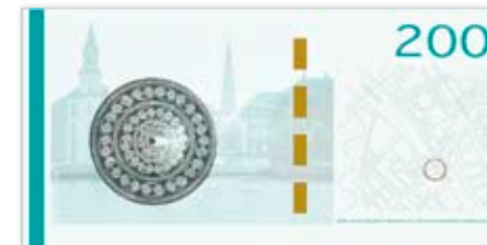
Oktober 2010 – Knippelsbro og Langstrup-bæltepladen (skitse)