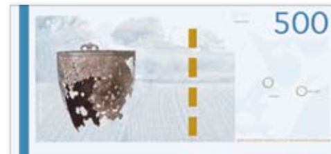
Februar 2011 – Dronning Alexandrines bro og Keldby-spanden (skitse)