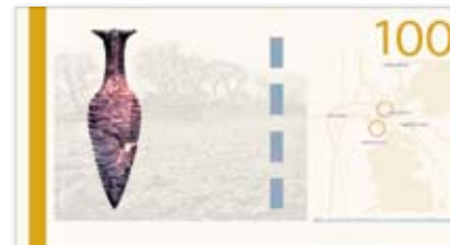
Maj 2010 – Den gamle Lillebæltsbro og Hindsgavl-dolken (skitse)