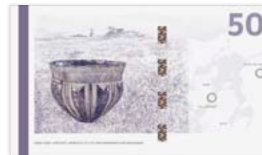
11. august 2009 – Sallingsundbroen og Skarpsalling-karret