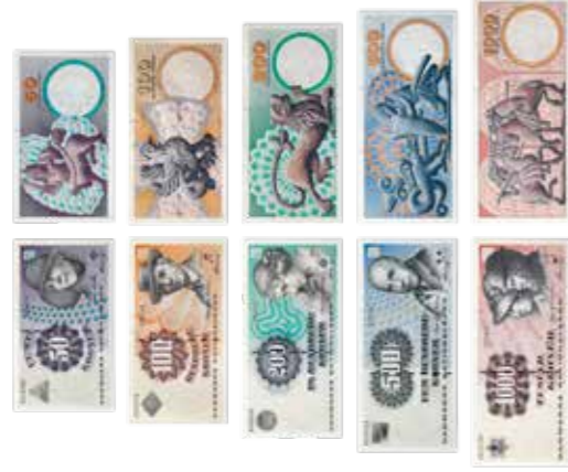
Portrætter og kirkekunst 1997