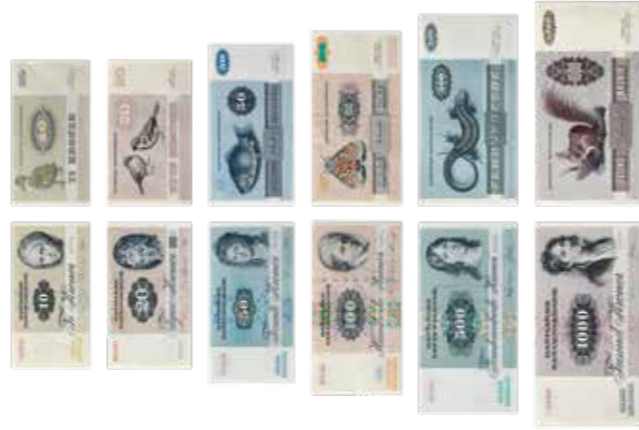
Portrætter og dyr 1972