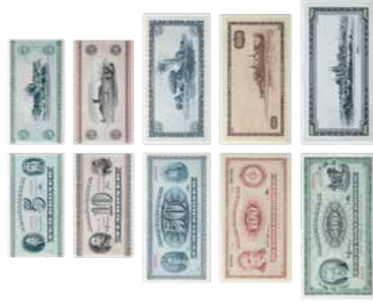
Portrætter og landskaber 1952